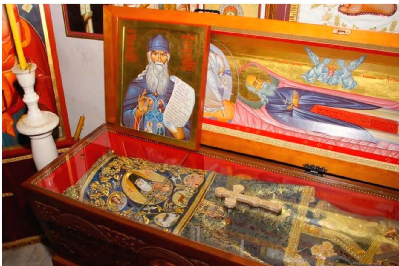
Мощи прп. Иустина Челийского (Поповича) в монастыре Челне (Сербия)